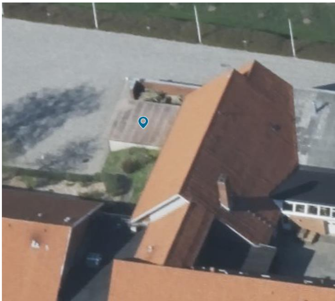
Figur 2 - Brændeskur